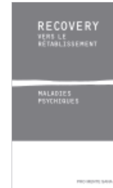
Recovery – Vers le rétablissement. Maladies psychiques. Pro Mente Sana, Genève 2011