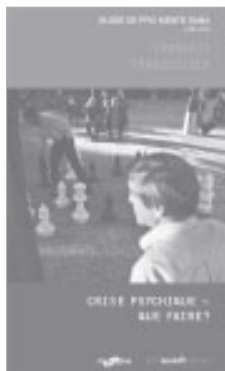
Crise psychique – Que faire ?, Guide de Pro Mente Sana disponible en sept langues (français, italien, portugais, espagnol, albanais, serbo-croate-bosniaque et turc), Genève 2010