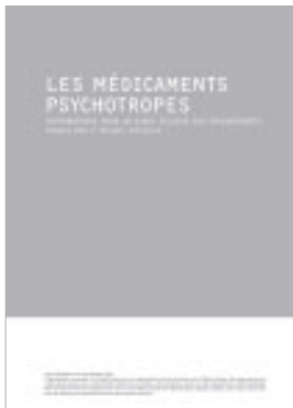
Les médicaments psychotropes. Informations pour un usage éclairé des psychotropes, Andreas Knuf et Margret Osterfeld, Pro Mente Sana, Genève 2007