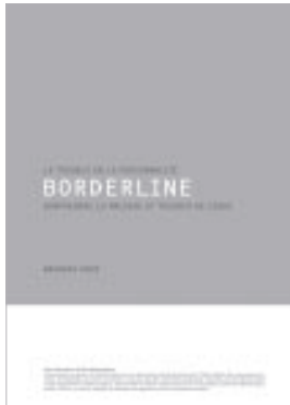
Le trouble de la personnalité borderline. Comprendre la maladie et trouver de l'aide, Andreas Knuf, Pro Mente Sana, Genève 2006