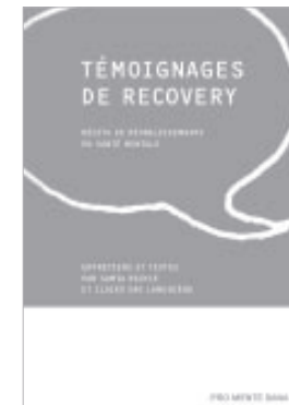
Témoignages de Recovery – Récits de rétablissements en santé mentale Entretiens et textes par Samia Richle et Ildiko Dao Lamunière. Pro Mente Sana, Genève 2012